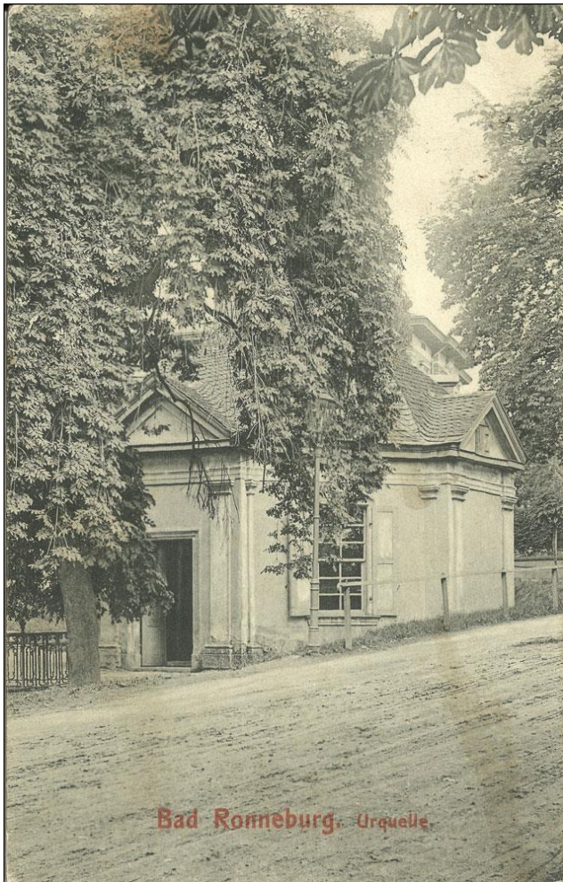
Bad Ronneburg, Urquelle