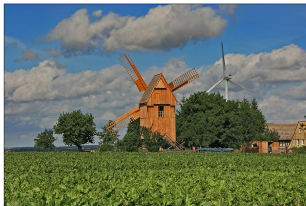
Das heutige Mühlenensemble